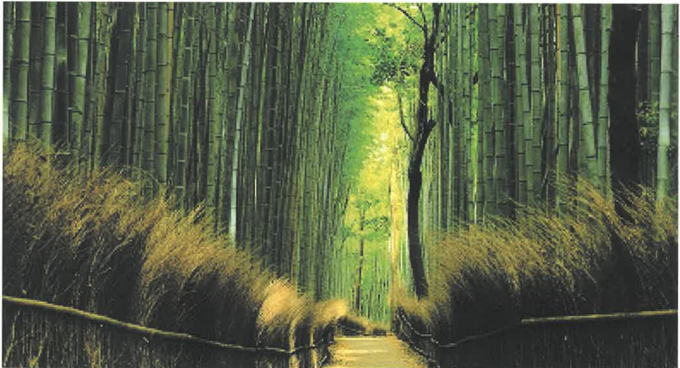
写真：「嵯峨の竹林」片山心