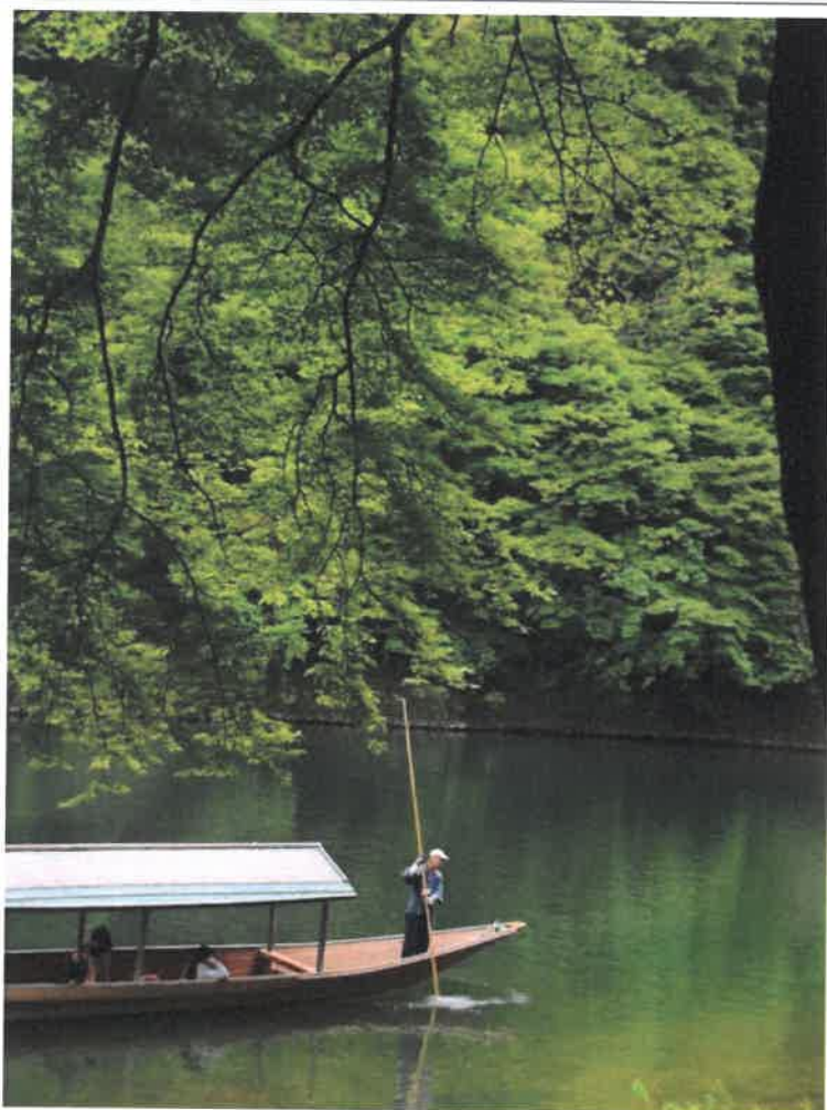
嵯峨野路の四季より