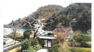
「らんざん」例会場より