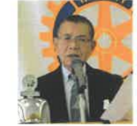
福田プログラムの委員