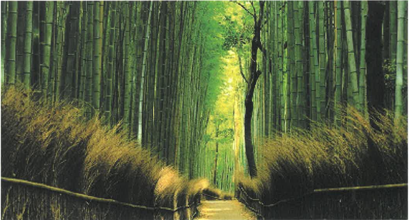
写真：「嵯峨の竹林」片山 心