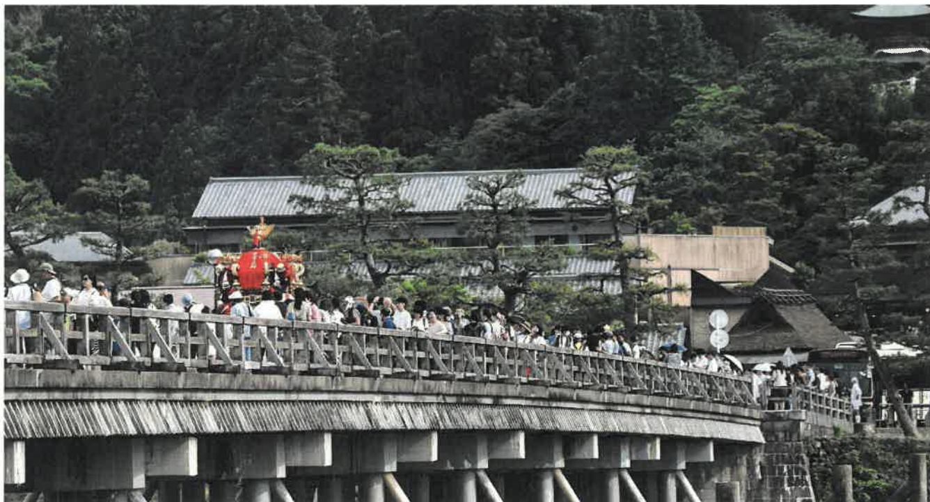
写真：「渡月橋と嵯峨祭神輿」片山心