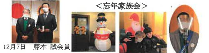
12月7日 藤本 誠会員