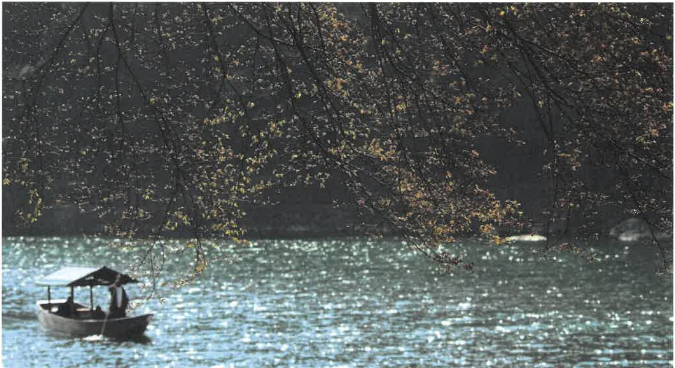
嵯峨野路の四季より