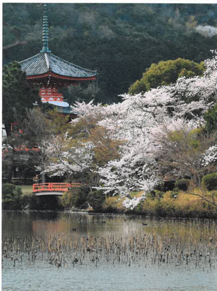
嵯峨野路の四季より