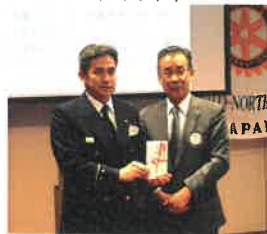
右京ジュニア消防団へ寄贈