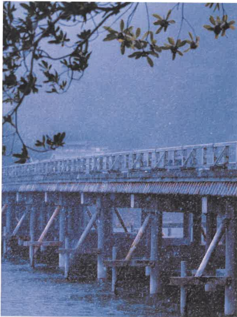
嵯峨野路の四季より