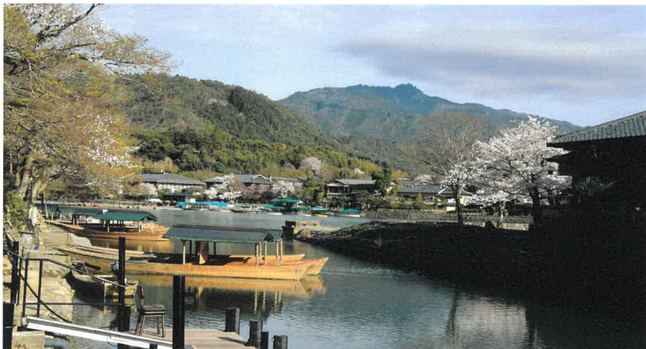
嵯峨野路の四季より