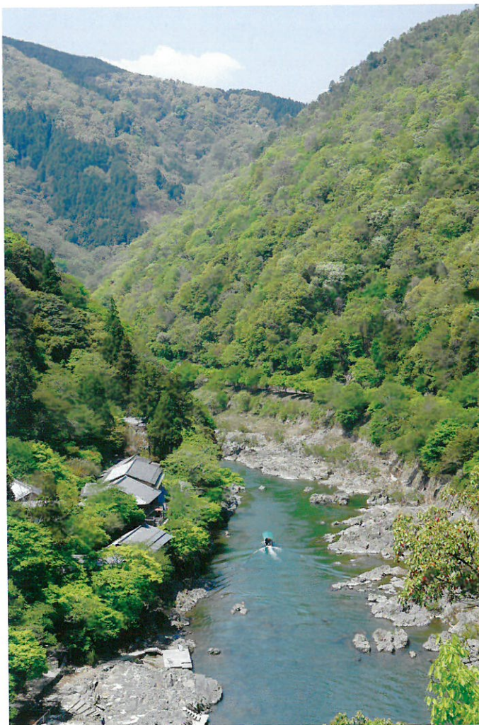
嵯峨野路の四季より