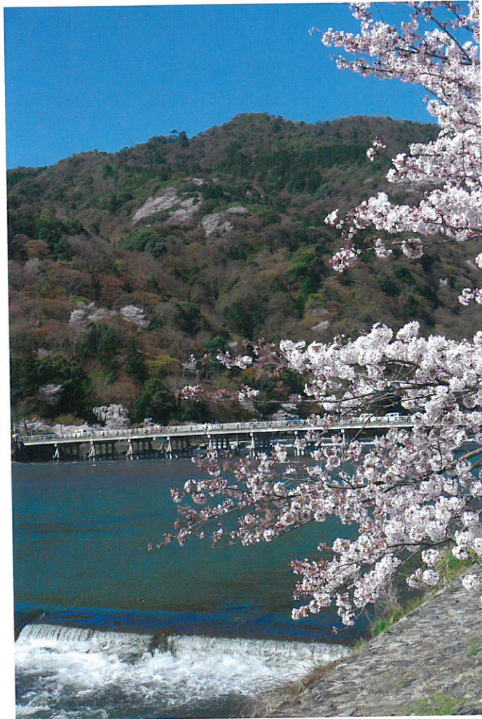
嵯峨野路の四季より