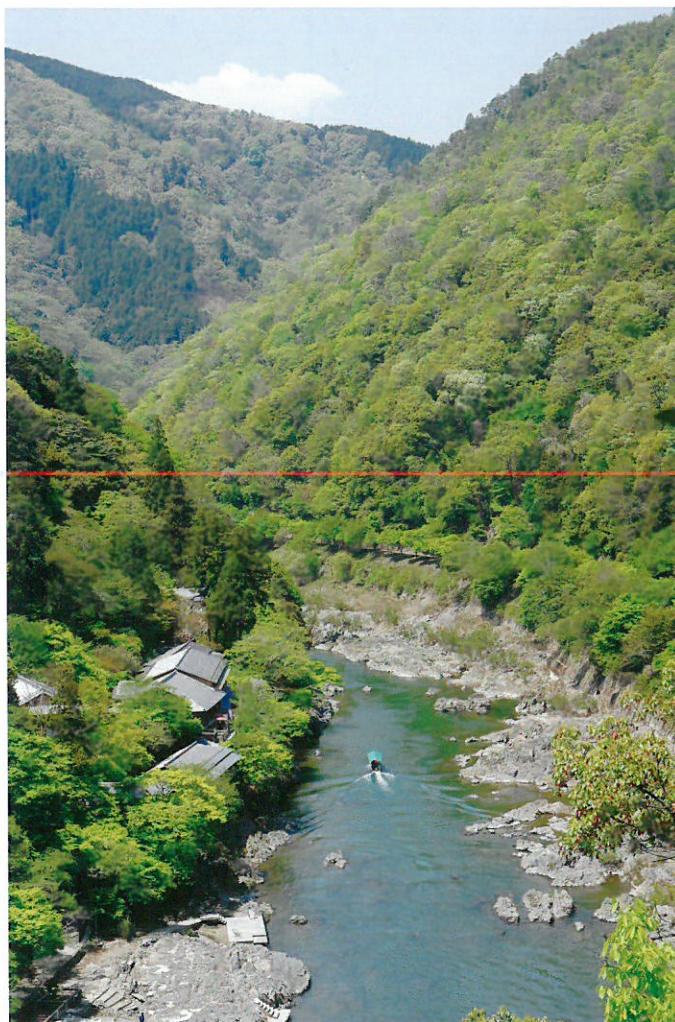
嵯峨野路の四季より